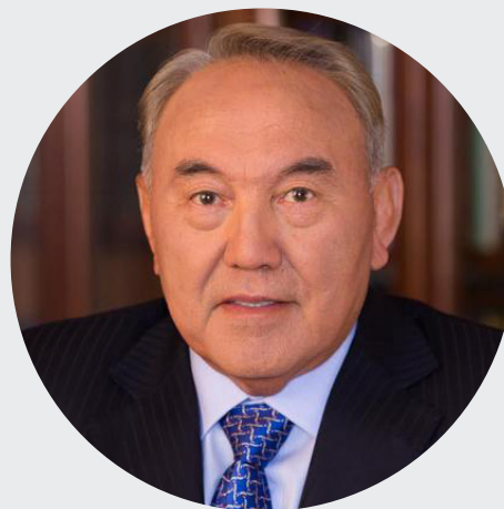
НҰРСҰЛТАН НАЗАРБАЕВ Қазақстан Республикасының Тұңғыш Президенті – Елбасы 2018 жылғы 26 қаңтар

Бұл үшін АХҚО халықаралық серіктестікті ынталандыруға және инвестициялық жобаларды жетілдіруге арналған жан-жақты саясатты әзірлейді. Орталық, сонымен қатар әлемдік деңгейдегі басқа қаржы институттарымен және жетекші жаһандық компаниялармен байланысты нығайта отырып, ауыл шаруашылығын қаржыландыруды және жылжымайтын мүлікке инвестиция салуды қоса алғанда, ұсынылатын өнімдер мен қызметтер аясын кеңейте түседі.